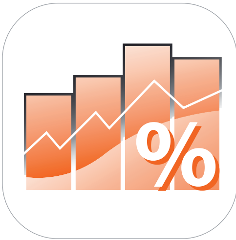
Des graphiques clairs